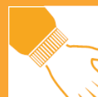
TRIKOT- MANSCHET- TEN