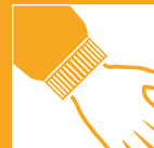
TRIKOT- MANSCHET- TEN